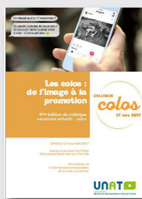
Les colos : de l'image à la promotion