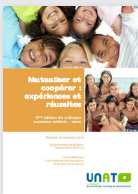
Mutualiser et coopérer : expériences et réussites