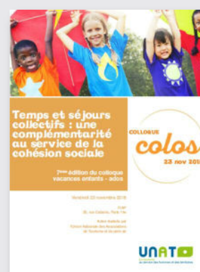
Temps et séjours collectifs : Une complémentarité au service de la cohésion sociale