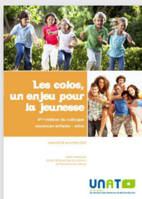
Les colos, un enjeu pour la jeunesse