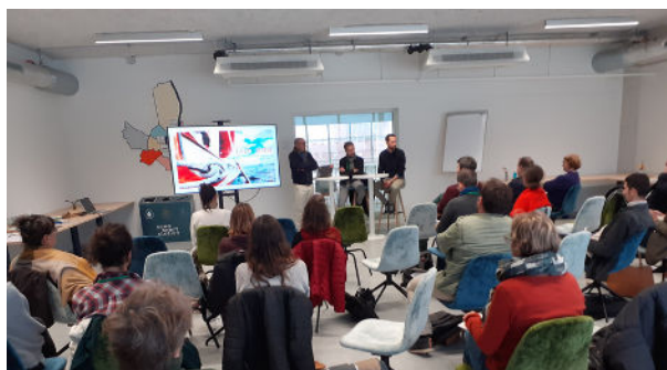
Table ronde n°1 : Face aux problématiques de l'énergie, quelles solutions existe-t-il ?

Nous avons donc pu aborder la question du Décret Tertiaire, des déchets, de l'alimentation ainsi que celle de l'eau !